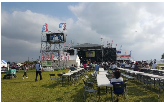
おやじラブロックフェスティバル

10月31日11月1日に開催された「おやじラブロック」では¥86,295、11月21～23日に開催された「離島フェア」では¥373,381の募金が集まりました。募金にご協力くださった皆様、ありがとうございました。