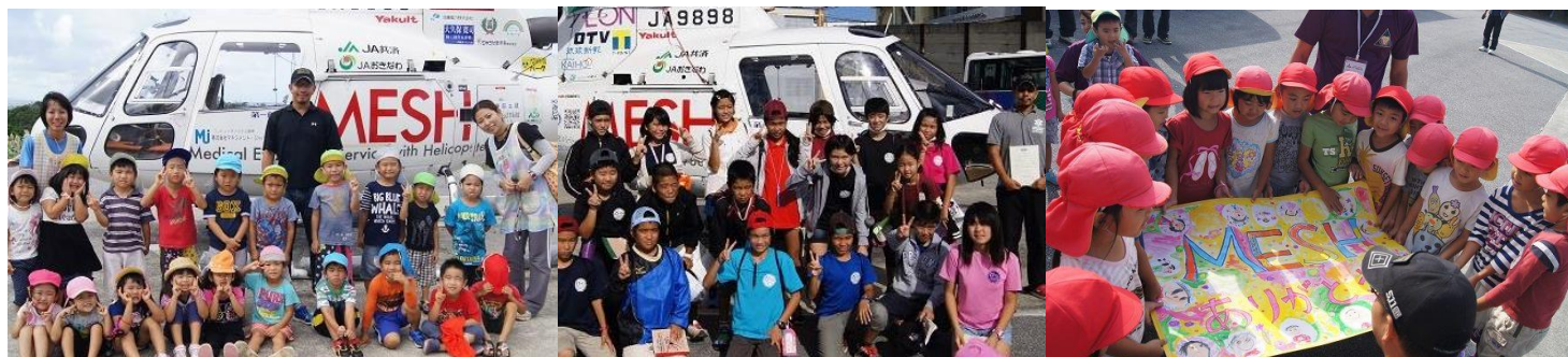
風の子保育園の皆さん