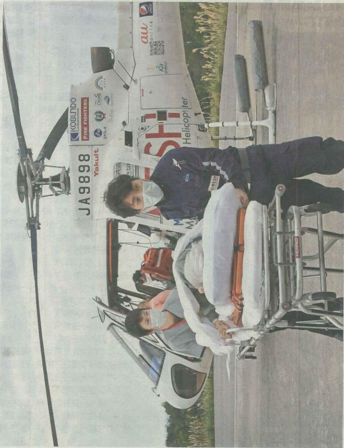
ヘリポートに到着し、担架で運び出される救急患者