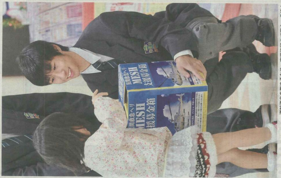
運航資金を集めるため、商業施設内で募金への協力を呼びかけるボランティアの高校生(那覇市で)

力団体は約70に上る。運航資金は、協力店舗の募金箱や売り上げの一部が寄付される飲料水の自動販売機からも集められる。13年末から3年間、北部広域市町村圏事務組合の補助金を受け、今年年間運航費約6200万円の半額ほど。活動を支える柱が民間の力であることは変わらない。