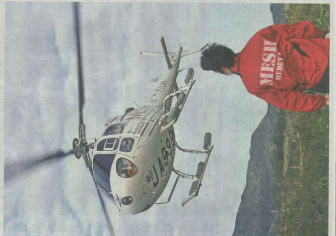
無縁にも出動要請の声が格別響き鳴り響く。わずか3分でヘリは飛立った